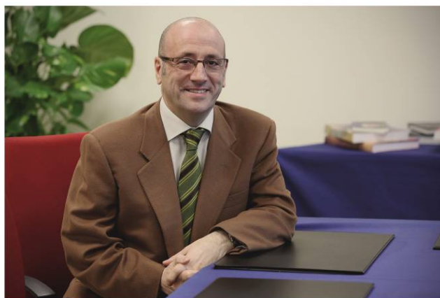
FÉLIX BROCATE PURI DIRECTOR GENERAL DEL DEPORTE GOBIERNO DE ARAGÓN

Aprovecho la ocasión para manifestar mi apoyo a la realización de estos eventos, que gracias a su labor mantienen vivo y difunden día a día el deporte del bádminton en la geografía aragonesa.